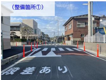
① スムーズ横断歩道（交差点部）