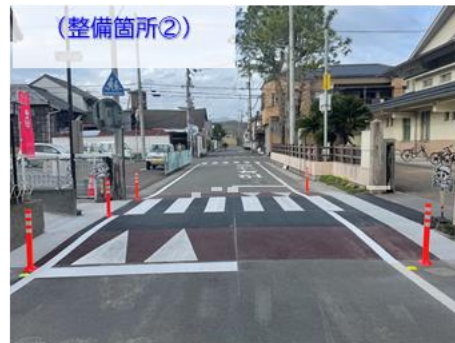
② スムーズ横断歩道(単路部)