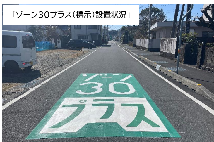
「ゾーン30プラス(標示)設置状況」