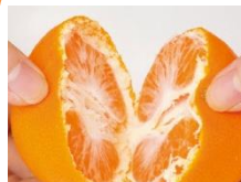
へたのほうから半分→4つにわる