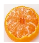
うえとしたをまるくきりぬきひらく