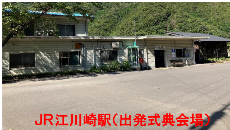
JR江川崎駅(出発式典会場)