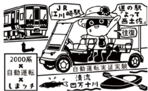
【押印できるスタンプ】