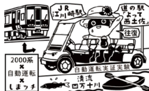
【押印できるスタンプ】