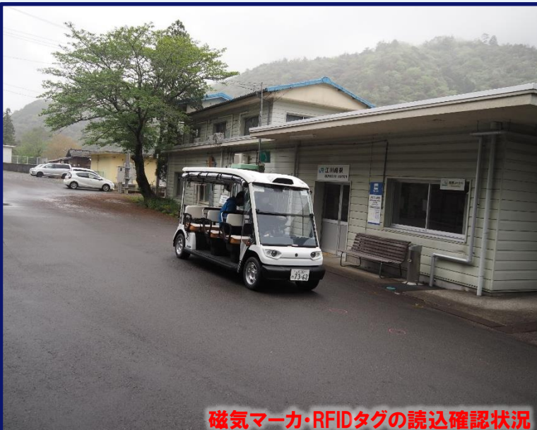
磁気マーカ・RFIDタグの読込確認状況