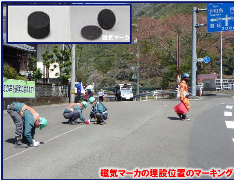
磁気マーカの埋設位置のマーキング

安全を第一に実りのある実証実験にしたいと思いますので、引き続きのご理解、ご協力をお願いいたします。