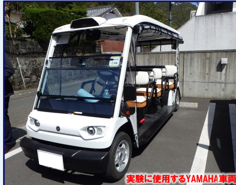
実験に使用するYAMAHA車両