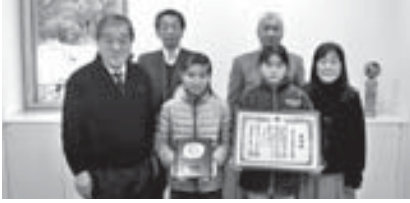
児童代表、校長の教育長への報告にて

これらの取り組みが、交通安全思想の高揚と交通秩序の確立に貢献しているとして、四国管区警察局長ならびに、四国交通安全協会会長から感謝状が贈られました。