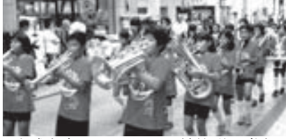
地域安全パレードへの鼓笛隊の参加