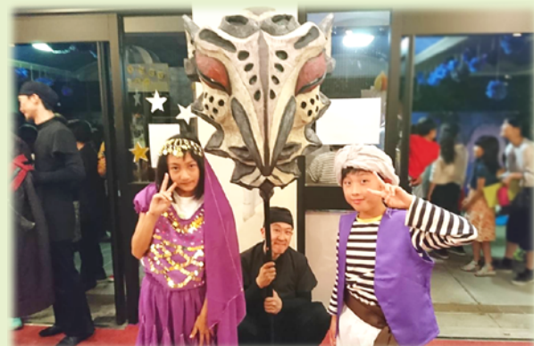
人形劇回むすび座・アラビアンナイト