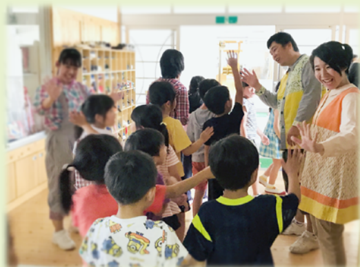
劇団うらみこ・夜明けの落語