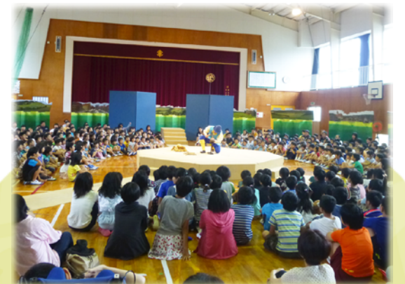
劇団風の子・陽気なハンス