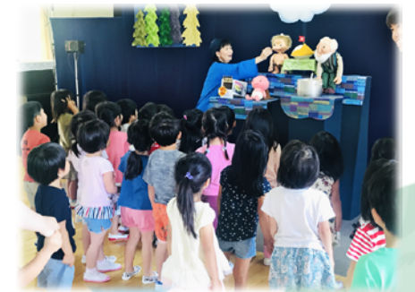
人形劇団むすび座・カミナリカレー