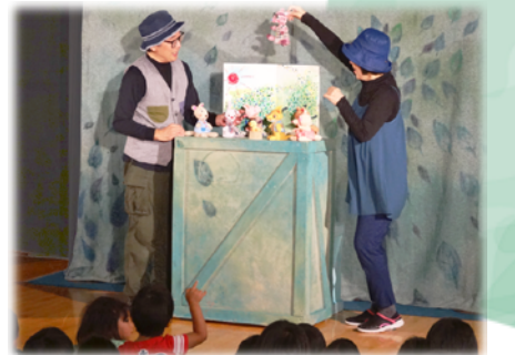
くわえ・ぱぺっとステージ&人形芝居ひつじの カンパニー・みても、いい？