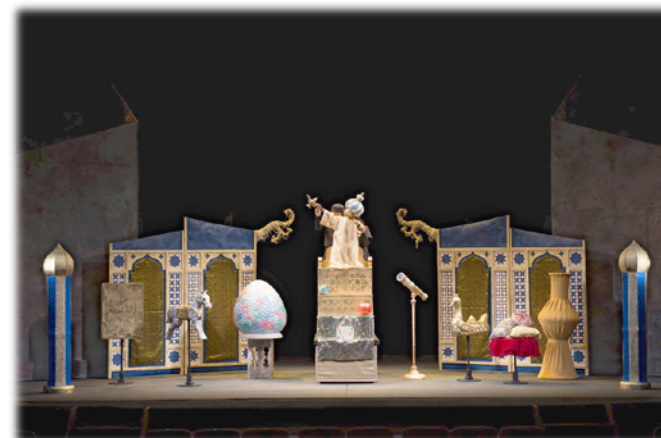
人形劇団むすび座・アラビアンナイト