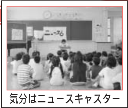
気分はニュースキャスター

蕨岡小学校では、昨年度から“表現力豊かな児童の育成”を研究主題として児童会活動や発表朝会などに取り組んでいます。10月3日（金）には、取り組みの一環として「わらびっこ集会」が、全校児童の参加により行われ、児童会や学級などからそれぞれ工夫を凝らした発表があり、成果のあとが感じられました。