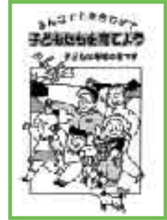
中村の教育を考える会

中村市としての会の開催は最後となりましたが、これからも地域の宝をみんなで育てていくために、学校・家庭・地域・教育委員会がそれぞれの役割と責任を果たしていかなければなりません。