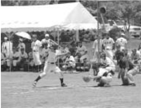
優勝：市立中村中 準優勝：西土佐中

この大会は、西土佐中学校保護者会の主催で平成元年から開催されており、今年で20回目を迎えました。今年市立中村中、八束中、清水中、大方中、佐賀中、窪川中に加え高知市から高知大学付属中を迎え、西土佐中を含む8チームで熱戦がくりひろげられました。大会にはたくさんの方が応援に来ており、中学生のはつらつとしたプレーに声援を送っていました。