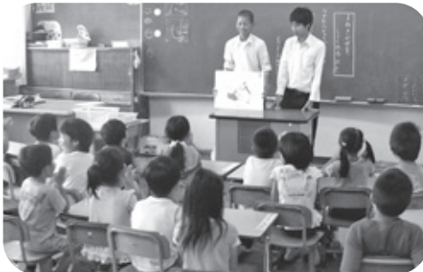
▲瞳をきらきらと輝かせて聞き入る小学生

4年ほど前から隣接する中村小学校へ出向き、「中学生による読み聞かせボランティア」の活動を行っています。この取り組みは、各学期に2回行って、1・2学期は3年生から、3学期は2年生から12人ずつの有志を募り、小学校1年生から6年生までの各クラスに2人1組で読み聞かせに入っています。