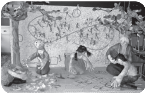
▲高知県知事賞を受賞しました!

利岡小学校では毎年、全校共同で紙の立体作品作りをしています。いの町紙の博物館で開催される「紙とあそぼう作品展」に出品するので、5月と6月の2カ月間で作品を仕上げました。