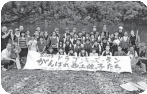
▲がんばれ西土佐っ子たち

「今日から2日間、みんなで仲良く助け合って、5年生の夏の楽しい思い出をつくりましょう。」