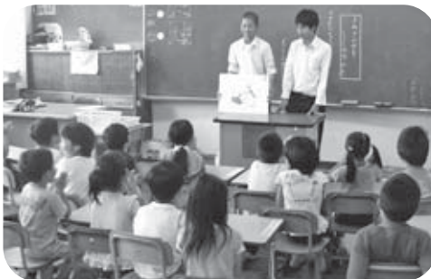
▲瞳をきらきらと輝かせて聞き入る小学生

4年ほど前から隣接する中村小学校へ出向き、「中学生による読み聞かせボランティア」の活動を行っています。この取り組みは、各学期に2回行って、1・2学期は3年生から、3学期は2年生から12人ずつの有志を募り、小学校1年生から6年生までの各クラスに2人1組で読み聞かせに入っています。