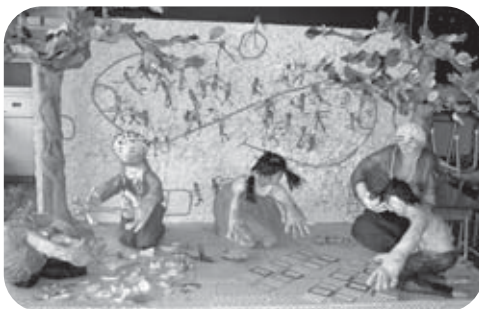
▲高知県知事賞を受賞しました!

利岡小学校では毎年、全校共同で紙の立体作品作りをしています。いの町紙の博物館で開催される「紙とあそぼう作品展」に出品するので、5月と6月の2カ月間で作品を仕上げました。