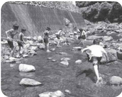
▲しゃくり漁スタート