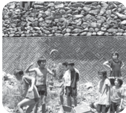
▲大きな鮎をかけました

このような体験ができる自然の豊かさ。そして、いろいろな活動に進んで協力してくれる地域の人々とのふれあいの中で、古里が大好きな子どもたちが育っています。