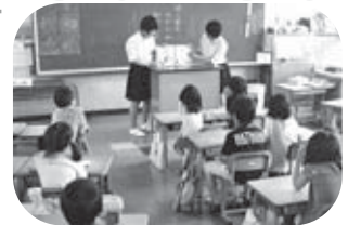
▲緊張した様子の中学生

4年ほど前から隣接する中村小学校へ出向き、「中学生による読み聞かせボランティア」の活動を行っています。この取り組みは、各学期に2回行って、1・2学期は3年生から、3学期は2年生から12人ずつの有志を募り、小学校1年生から6年生までの各クラスに2人1組で読み聞かせに入っています。