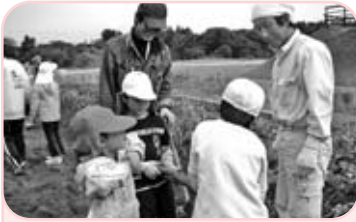
長いおいもだったので、手伝ってもらってやっとほれました。