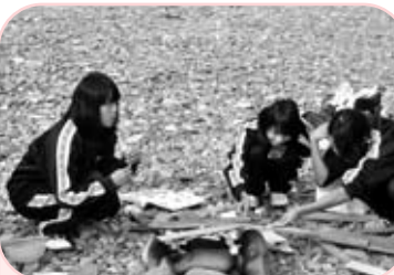
なかなか火をつけるのは難しいなあーさまざまなメニューを考えました。

「仲間と協力する。」それが、自然体験学習のテーマの一つでした。準備の時からなるべく先生の助言を得ずに話し合い、焼き鳥、パエリア、焼きうどん、カレーと