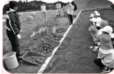
みんなでほったおいもを集めてみました。

軍手でおいものまわりをほったら、やっとぬけました。おいもの形は、お肉みたいでした。土の色は、さいしょ