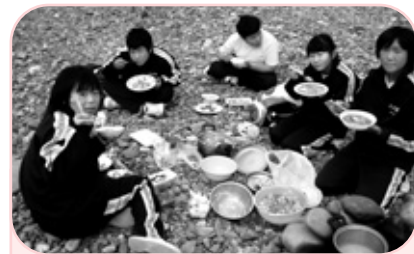
少し失敗しました！おいしさはこの失敗を来年に生かします

当日のも自分たちだけで調理に取り掛かりました。成功した班もあれば、ご飯が焦げるなど失敗した班もありましたが、どの班もみんなが協力し、最後まで笑顔