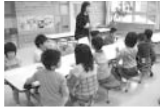
地産地消について勉強中

1500食もの給食を作っているセンターの大きさや、なべや機械で作業しているところを興味深く見つめていました。