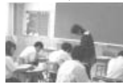
なかなかできちようね～