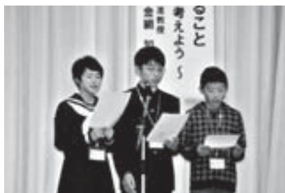
サミット宣言(案)発表