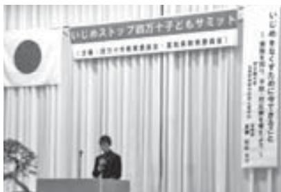
実行委員長あいさつ