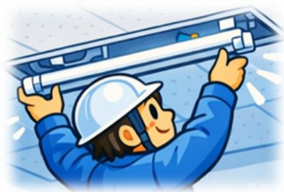
既存の LED 照明以外の照明器具から…

国の物価高騰対応重点支援地方創生臨時交付金制度を活用し、物価高騰の影響を受ける市内事業者の LED 照明設備の導入に要する費用の一部を補助することで、事業継続と経営安定化を支援するとともに、温室効果ガスの削減を図ります。