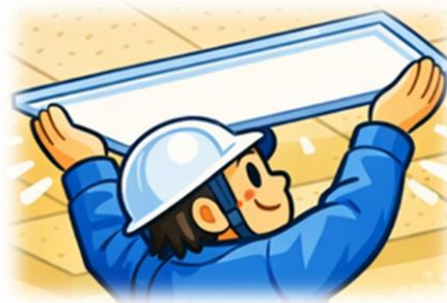
要件を満たす LED 照明器具への更新