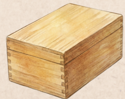
木箱や専用の保存箱