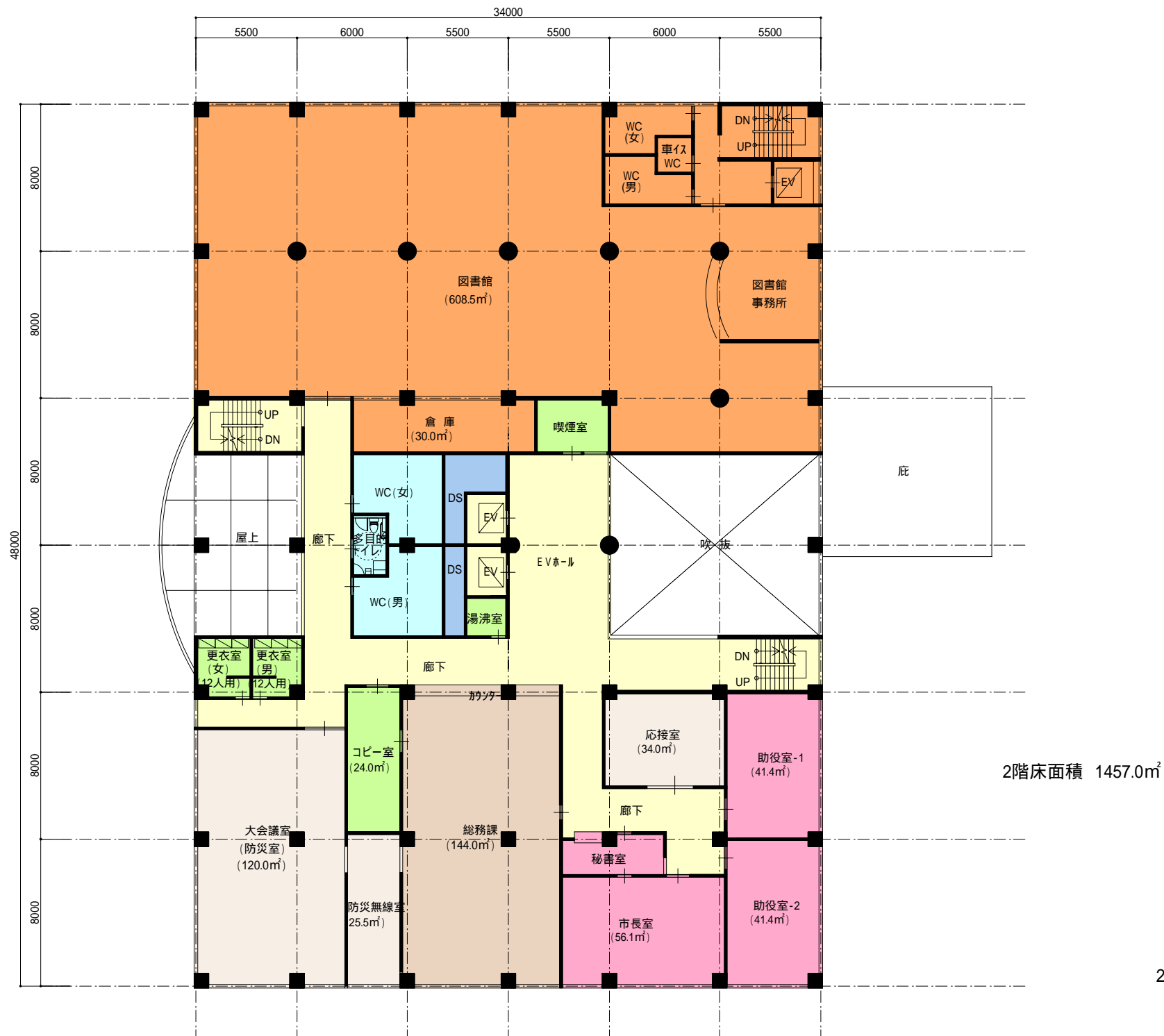
2階 平面図 S=1/200