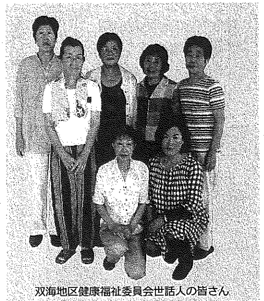
双海地区健康福祉委員会世話人の皆さん

この活動には、本人からの自己負担と市が健康福祉委員会に支払う委託料が使われています。試験的な活動として始められたそうですが、参加した方からの反応も良く、今後ますます支援の必要な方が増えていくことも見込まれているため、健康福祉委員会の活動として定着させていきたいと話されていました。 買い物リストを手に、いきいきとした表情でお買い物される皆さんの笑顔がとても印象的でした。