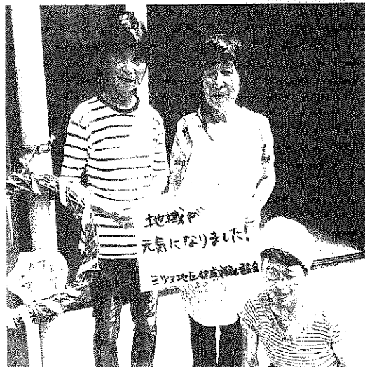
三ツ又地区健康福祉委員会世話人の皆さん

午前10時、カフェの開店時間になると、夏休みで遊びに来ていたお孫さんも一緒に地区住民が続々と集まってきました。地区住民から「交流の場がほしい」といった声を受けて始まったカフェですが、前日の地区放送で三ツ又地区の住民全員に声をかけるとほぼ全員が参加されるといいます。地域が元気になるようにと、女性陣が協力しながら運営しています。今後は、高齢者への生活支援にも力を入れていきたいと笑顔で話してくれました。地区外の方も参加できますので、笑顔溢れる山里のカフェを一度覗いてみませんか。