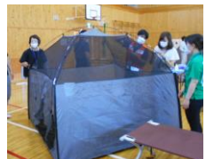
飛沫感染防止のための室内テント