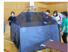
飛沫感染防止のための室内テント