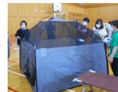
飛沫感染防止の ための室内テント