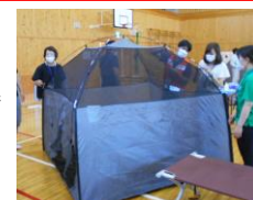
飛沫感染防止のための室内テント