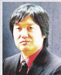
ピアノ伴奏：落合 敦